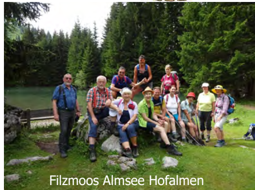
Filzmoos Almsee Hofalmen